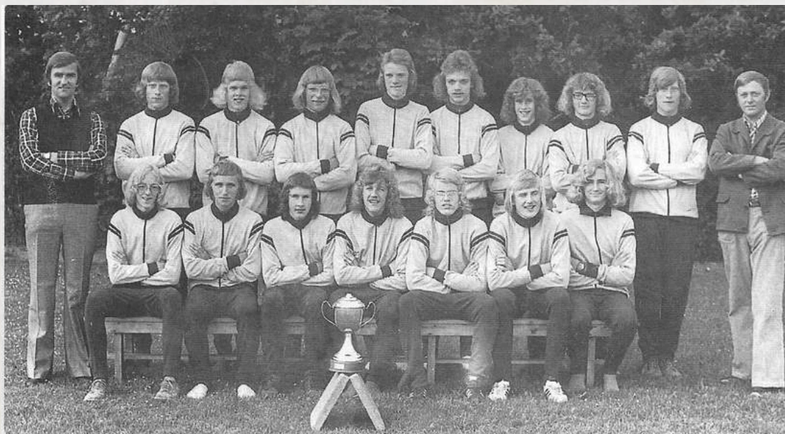
TFS A junioren in de 'FVB-cup' 1975