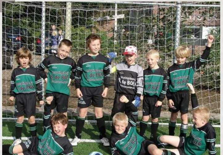
F1 kampioen 2010