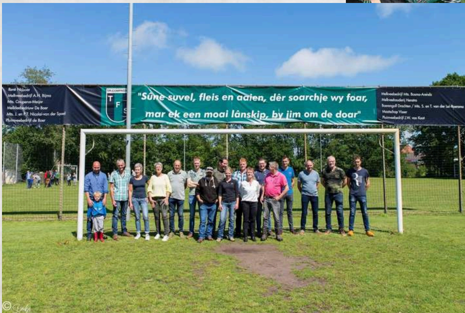
Prachtig spandoek sponsoring lokale boeren