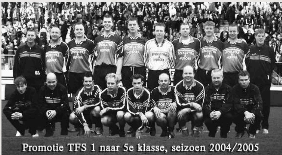
Promotie TFS 1 naar 5e klasse, seizoen 2004/2005

In het seizoen 2004/2005 dwingt het eerste team van de zondag promotie af naar de 5e klasse.