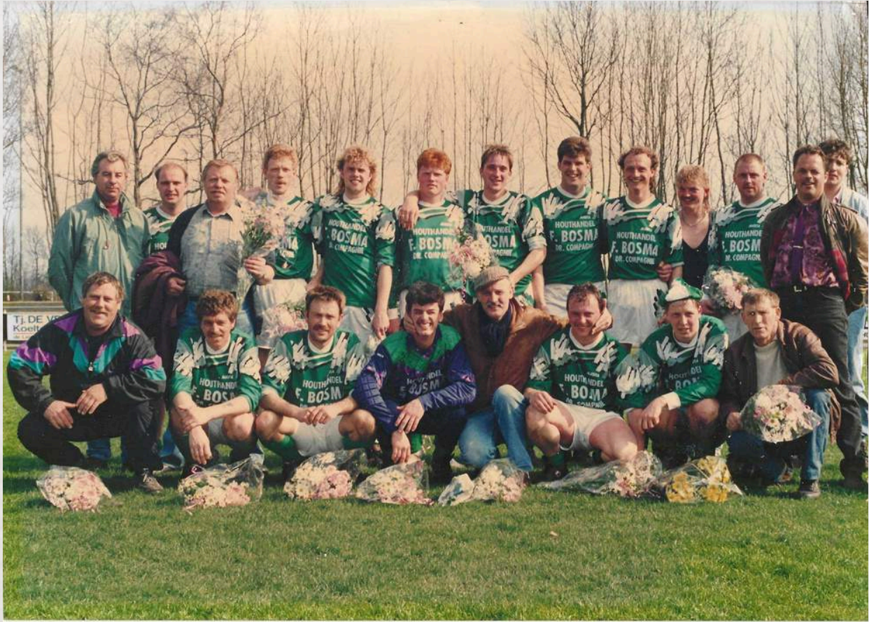
ZM I kampioen seizoen 1992/1993