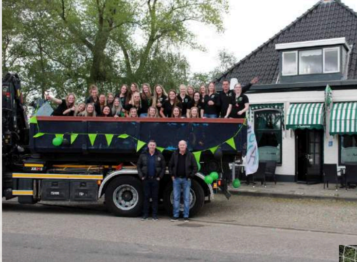
Dames kampioen 2019